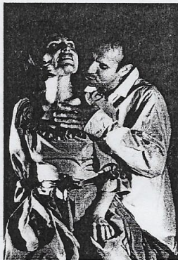
La Voie Lactée dans Le Libertin d'E-E Schmitt

La Compagnie est constituée de plus de 25 personnes, comédiens dont plusieurs animateurs, tous bénévoles. Elle est installée à Cugnaux depuis 1985. Elle est issue de la section théâtre de l'Association Sportive et Culturelle du CNES (ASC). Fortement soutenue depuis par sa création par l'ASC, elle est depuis 2002 en relation de coproduction avec l'ASC. Elle bénéficie par ailleurs du soutien matériel fidèle de la Mairie de Cugnaux.