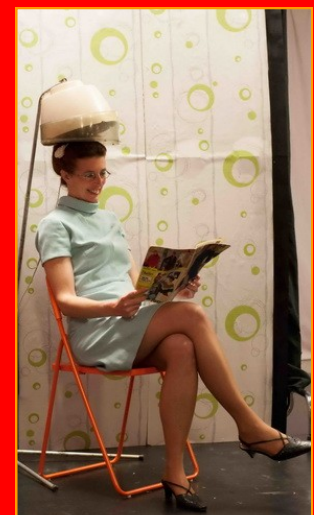
COIFFURE POUR DAMES Cie Le Sens des Planches 10 avril 17h30 Castelnau d'Estrétefonds