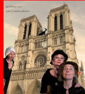
AMOUR, RAPT et MECHANCETE Cie Les Chats Laid 9 avril 20h30 LEVIGNAC