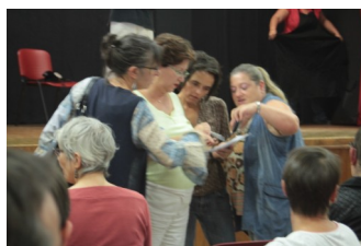
Petites Formes et Cies 2014

Montberon avec la participation de 21 troupes qui présenteront des spectacles divers et variés, toujours de grande qualité. Vous avez pu prendre