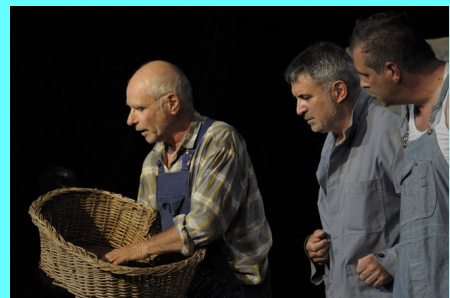
DES SOURIS ET DES HOMMES Théâtre du Beau Fixe 17 mai : Foyer Rural GRENADE