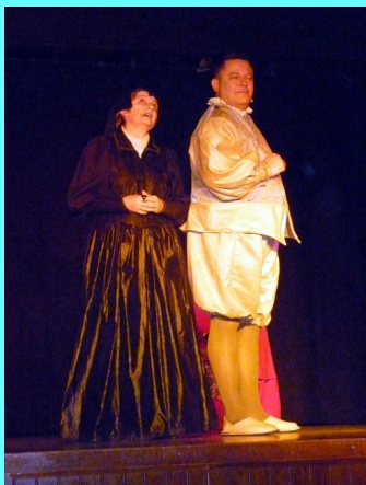
LA NUIT DES REINES Les Santufayons 16 mai 20h30 Péniche Didascalie