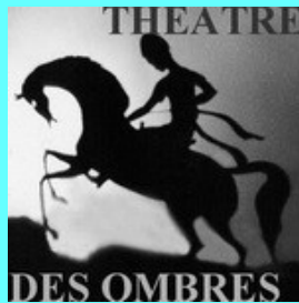
CONTES DE KIPLING ET DE LA FONTAINE Théâtre des Ombres 13-14-15 mai : Théâtre du Pavé