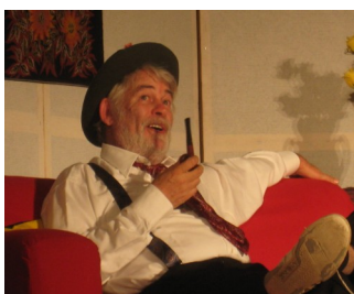
Un nouveau président au CD 31

tionnement du CD 31 et permettre la promotion du théâtre amateur, au service des troupes adhérentes en Haute Garonne.