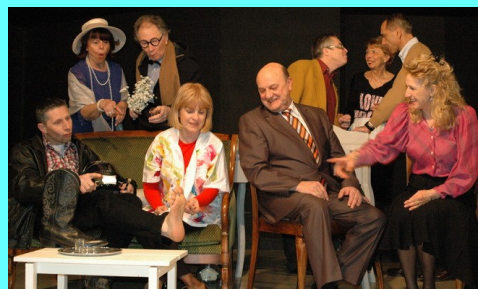
LA BONNE ADRESSE Les Couleurs de la Comédie 16 mai 21h S. d. F.LAUNAGUET 23 mai 21h Esp. LIMAYRAC 27 mai 21h Esp. BONNEFOY