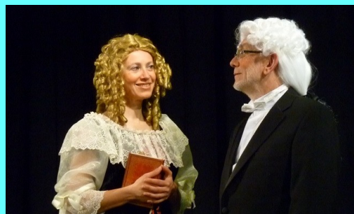
MADemoiselle SE MARIE Théâtre en Plain Chant 27 avril 16h LABASTIDE SAINT PIERRE 18 mai 21h SALLE DES AMIDO TOULOUSE