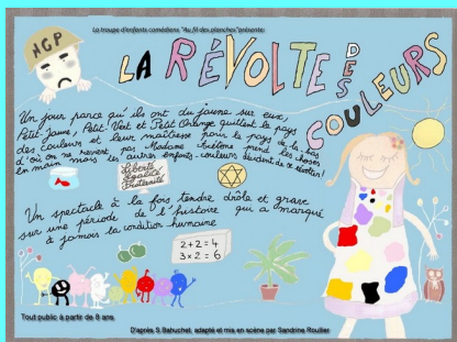
Cie Au Fil des Planches 17 mai 21h Ferme de Bouzigues MONTAIGUT SUR SAVE