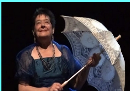
L'ÂME AU CORPS Cie des Sylphes Le 2 mai à LATRAPE (31)