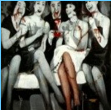
LA MAISON DE BERNARDA ALBA mercredi 3, jeudi 4 et vendredi 5 juillet par la Cie Ping Pong sous les arbres