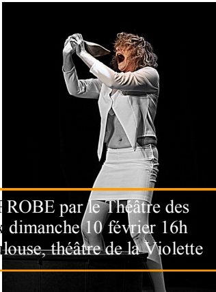
DIE FROBE par le Théâtre des neaux dimanche 10 février 16h à Toulouse, théâtre de la Violette