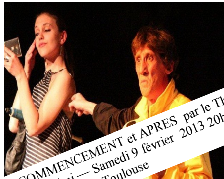
AU COMMENCEMENT et APRES par le Théâtre d'Aujourd'hui — Samedi 9 février 2013 20h30 au Théâ- tre de la Violette à Toulouse