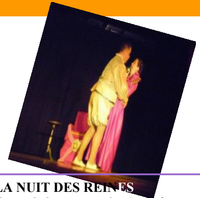
LA NUIT DES REINES de Michel Heim par les Santufayons aura lieu au Centre Culturel de Beauzelle le samedi 2 février 2013 à 21h00