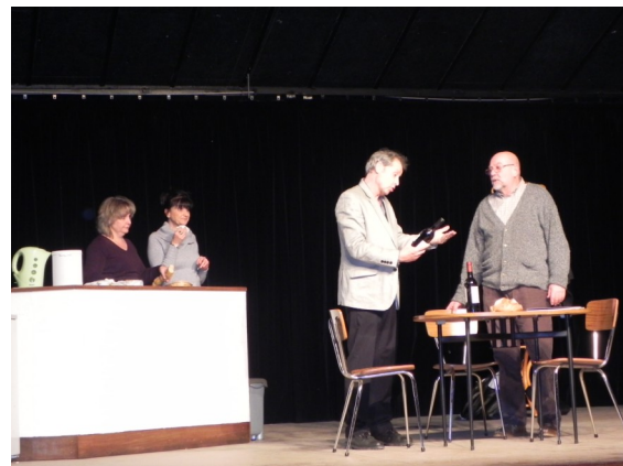
CHOCOLAT PIMENT par le Strapontin de la Belugo Samedi 9 février à 15 h au Centre Culturel des Mazades