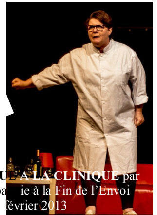
PANIQUE A LA CLINIQUE par Compagnie à la Fin de l'Envoi lundi 11 février 2013 à la MJC de Castanet Tolosan (31)